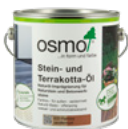
Stein- und Terrakotta-Öl

Dadurch, dass das Imprägnier-Öl frei von bioziden Wirkstoffen ist, kann es auch unbedenklich im Bereich von Lebensmitteln verwendet werden, z.B. bei Stein von Grills.